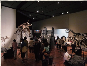
開館10周年の平成27年（2015）夏季企画展「大化石展」では歴代最多の利用者6万人達成。

山梨県立博物館（笛吹市）は、「山梨の自然と人」の歴史を伝える博物館として、平成17年（2005）10月にオープンし、令和2年（2020）で15周年を迎えます。博物館が収蔵する資料や成果は、多くの先人たちが遺した郷土山梨の歴史や文化についてのかげがえのない財産だと言えます。今回の山梨近代人物館の展示を通じて、郷土山梨の文化を発展させた人物たちの業績や思いに触れてみてください。