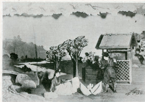
宝塚少女歌劇第1回公演歌劇「ドンブラコ」

近代という時代は、新たな知識や情報にあふれ、新しいライフスタイルや余暇の楽しみが登場した時代でした。近代社会において、新たな文化を創造した先駆者たちは、人々が生き抜いていくためのしるべとなる知識を広げ、生涯を豊かにする楽しみを提案していきました。