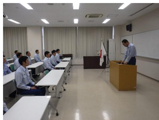
応用訓練・想定訓練 （講師：甲府地区消防本部）