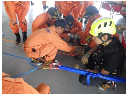
(講師：株式会社アルテリア)