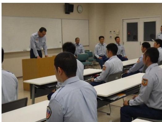
入 校 式