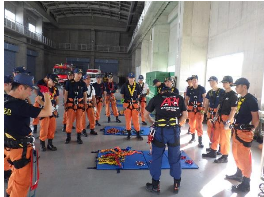
資器材取扱い (消防学校)