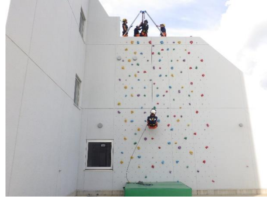
高所からの救助（講師：富士五湖消防本部）