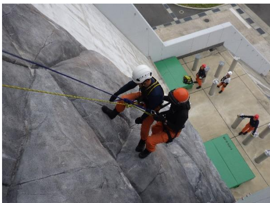
低所からの救助 (講師：峡北消防本部)