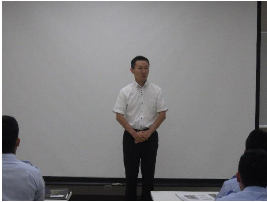
山岳救助概論 (講師：山梨県警察本部 宮城講師)