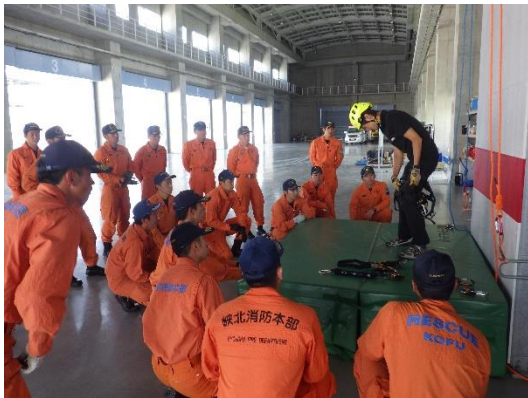
高所作業の原則・山岳救助