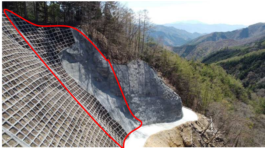
対策完了状況 (R2崩落部)