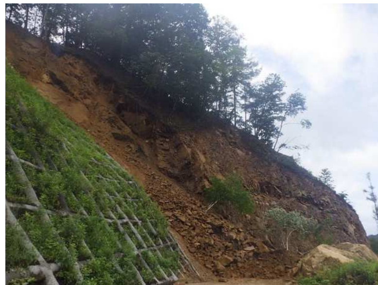
令和2年9月8日降雨による崩落