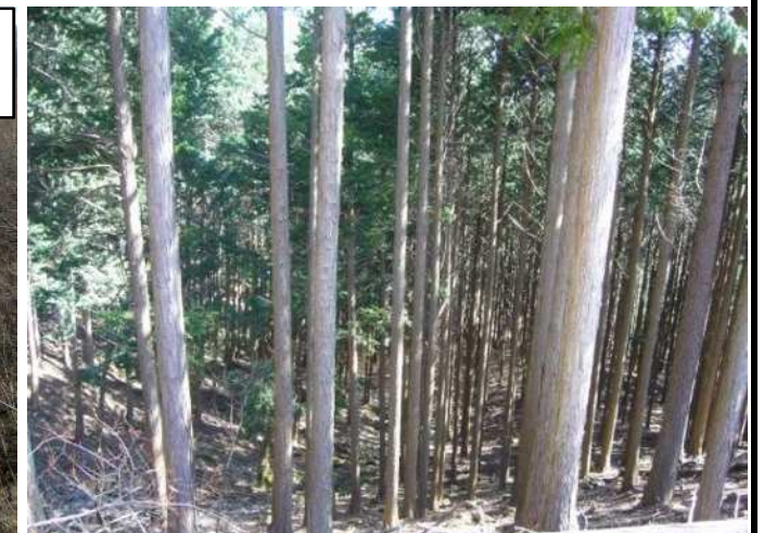
③ 先線計画箇所の現地状況