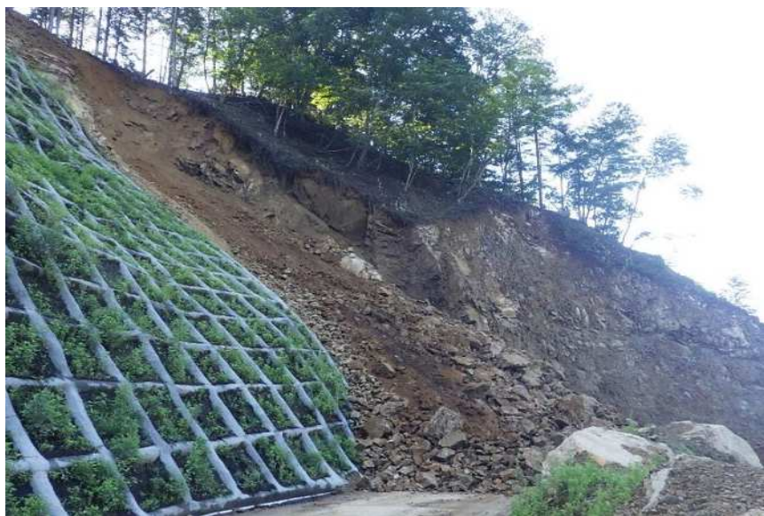
令和2年8月26日降雨による崩落