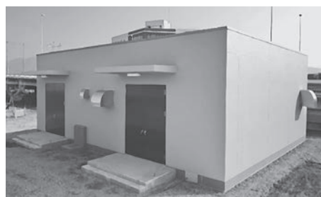
国道411号（仮称）砂田排水機場建屋