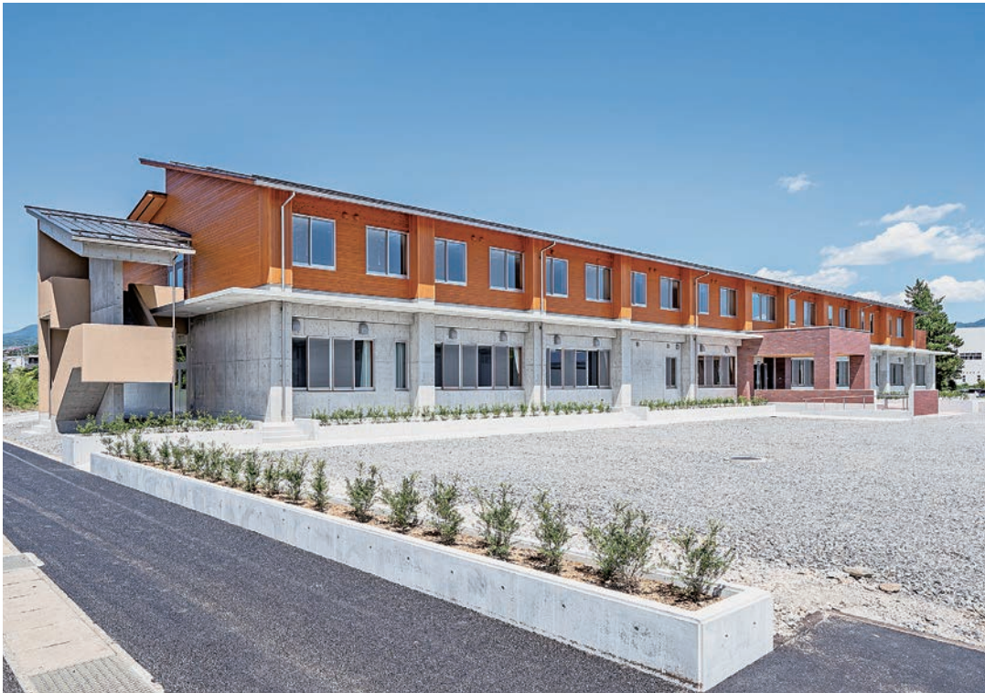
総合農業技術センター 外観