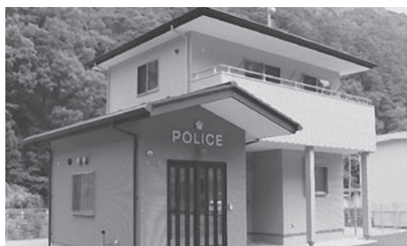
南アルプス警察署芦安駐在所