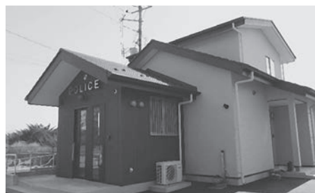
北杜警察署大泉駐在所