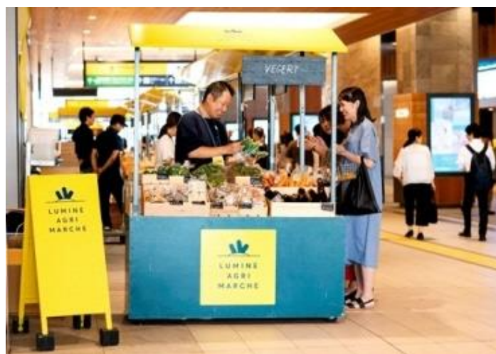
ルミネアグリマルシェ開催イメージ