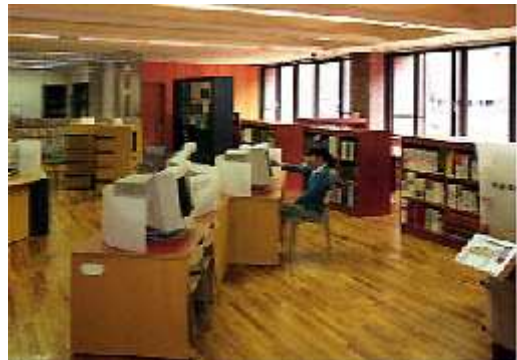
環境情報センター

本センターでは、環境に関する図書・ビデオ等を年々充実させていることに加え、コンピュータネットワークの整備等により、これら環境情報の提供の際の利便性の向上を図っています。さらに「ニュースレター」の発行等により、研究成果ほか研究所の各種活動の紹介も行っています。