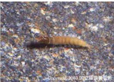
NO.11 コガタマヒケラ類