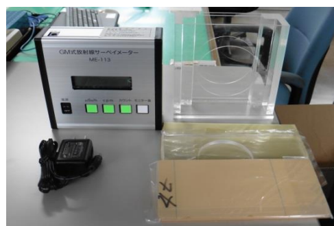
放射線遮蔽実験セット