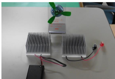
ペルチェモジュール実践セット