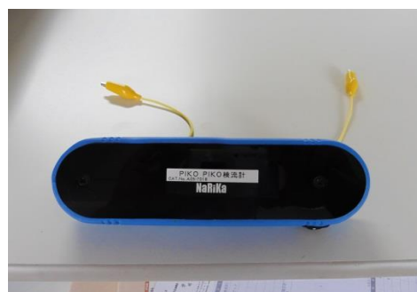
ピコピコ検流計（走光式検流計）