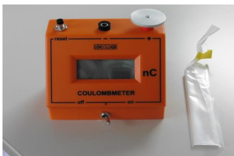
クローンメーター（デジタル静電量計）

新たにエネルギー教育関連教材が整備されましたので紹介します。授業に積極的に活用していただきますようお願いいたします。