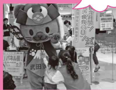
この他、マナーや伝統食、食べ物基礎知識等、様々な食育パネルの展示もあります。