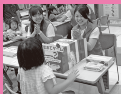
まめ運びゲーム・食育カルタ、1日に必要な野菜の量当てゲーム等