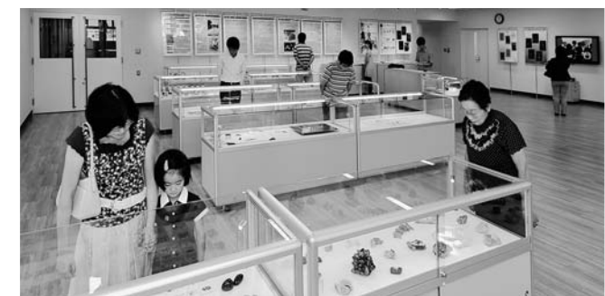
県立宝石美術専門学校 展示交流スペース