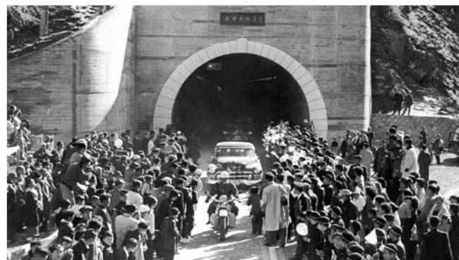
新笹子トンネル開通