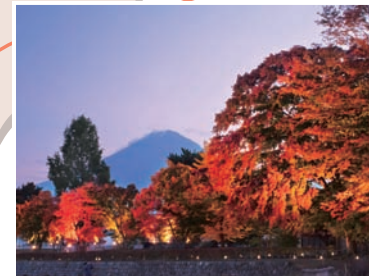
14 河口湖もみじ回廊