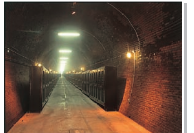
12 勝沼トンネルワインカーヴ