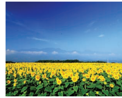
1 明野のヒマワリ畑