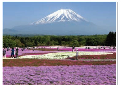
15 富士芝桜と富士山