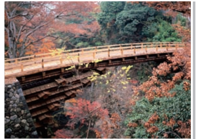
13 猿橋(日本三奇橋の1つ)