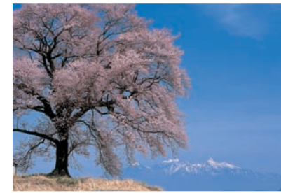
3 八ヶ岳とわに塚の桜