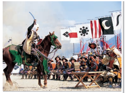
10 石和温泉郷(川中島合戦戦国絵巻)