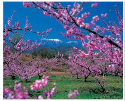
2 新府桃源郷と南アルプス