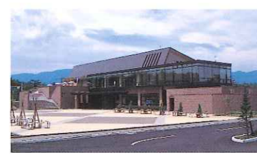
富士ビジターセンター

■富士ビジターセンター/富士山を登山、自然、文化、芸術・デザインのテーマ別に学んだり、周辺の観光スポットを紹介。レストランや土産物もあります。