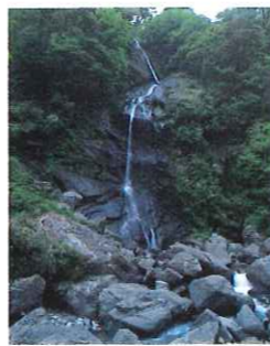
富士川 風吹きの滝

■六地藏公園/ここからの富士は新富嶽百景の一つ、昔から有名な景勝の地で今日では地蔵と富士の撮影ポイントとして人気があります。