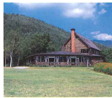
西野野鳥の森公園

■河口湖自然生活館/河口湖北岸の絶景の地に位置し、ブルーベリージャム作り教室や摘み取り体験が楽しめる。