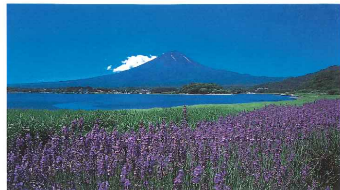
ラベンダーと河口湖

このコースは、わが国の代表的な観光地を通りますので、ホテル、旅館、ペンション、民宿など様々な施設が整っています。富士河口湖温泉郷も人気です。ただし、季節によっては混み合いますので、事前に該当市町村観光協会にご相談ください。