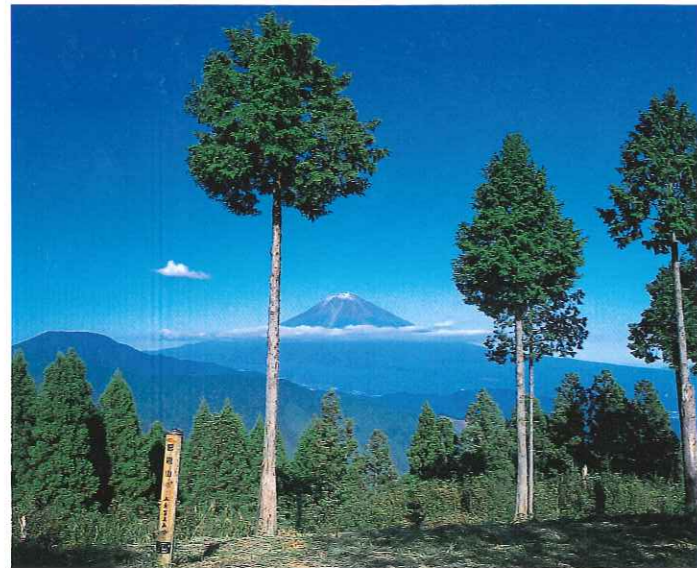
思親山からの富士山