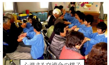
心温まる交流会の様子

さて、交通安全教室の後は、お楽しみの交流会です。園児による歌が披露され、じゃんけんや握手、肩を組んだり頬を寄せ合ったりと温かいふれあいが行われ、お遊戯室はしばし笑い歓声とに包まれました。老人クラブの会長さんは、「交通安全教室であらためて重要なことを学べた。何より園児のみなさんから、パワーをいただいた。2時間ほんとうに楽しく過ごすことができた」と挨拶をしました。最後に子どもたちは交通安全協会や老人クラブの方から、笑顔でプレゼントをいただきました。