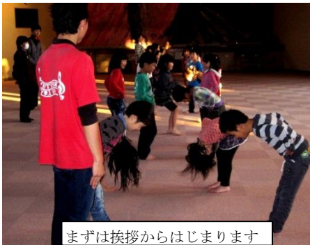
まずは挨拶からはじまります

「イチ、ニ、サン、キック イチ、ニ、サン、キック」足の甲を使いながら、キックミットを蹴り上げる姿は、まさに「テコンドー」そのもの。今回は、1・2年生の子どもたちが中心でしたが、活動が終わった後の表情は、とても満足そうでした。