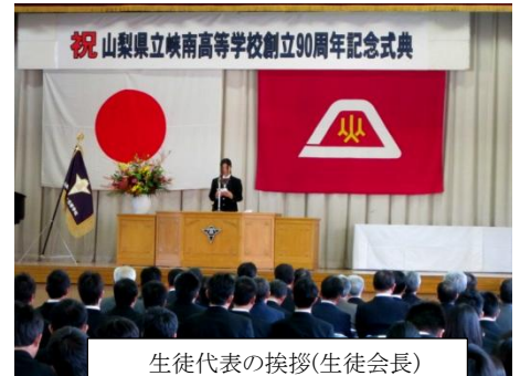
生徒代表の挨拶(生徒会長)

記念式典は、県・地域市町村・中学校及び高等学校関係者・同窓会及びPTAなどのほか地域住民の出席も得て盛大に行われました。また、午後には記念公演としてスチールパンオーケストラの演奏会があり、華やかで躍動感のある音楽に学校全体が包まれました。式典に参加した生徒の「90年という歴史の重みを受け継ぐことの大切さをあらためて感じた」と話してくれたことがとても印象的でした。