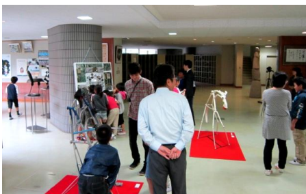
10月18日には、身延小学校4年生のミュージアム見学授業が行われました。

様々な角度からの話がなされました。そして自己肯定感を育むことの大切さが強調され、分かりやすい説明に、参加していた生徒は深く頷いていました。生徒代表によるお礼の言葉では、より前向きな高校生活が送れそうだと感謝が述べられました。家庭部門ではこのほか生徒の作品展示、エコキャンドルを作るワークショップや調理実習(12月)が行われました。