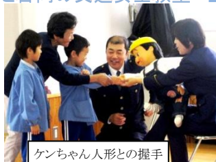
ケンちゃん人形との握手

まず男性のお巡りさんから、園児に「命を守る勉強」として、 ①道路で遊ばない、②とび出しはしない、③横断歩道を渡ろう、④右側を歩こう 、という4つの約束の話がありました。同じく高齢者に対しては、道路横断中にはねられる事故が多発している現状についての説明があり、その原因となっている 横断歩道のない場所での横断や車が接近しているのを見誤って道路を渡ってしまうこと などに十分注意する必要があること、日頃から蛍光反射付というような目立つ服装を心がけることなどの留意点が示されました。