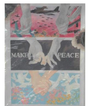
平和ポスター市長賞