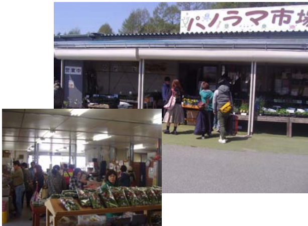
④ 農産物の販売促進 農産物の直売所が賑わいを見せる。