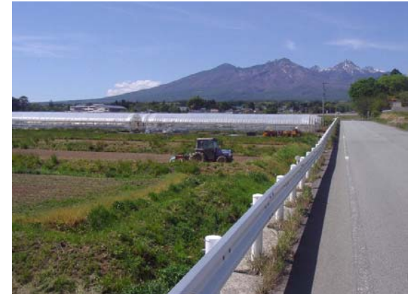
③ 農産物の生産性向上 広域農道が整備により、野菜のビニール ハウス栽培等が盛んになっている。