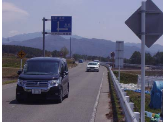
② 集落間・小規模拠点施設へのアクセス向上 広域農道を利用した集落間の往来