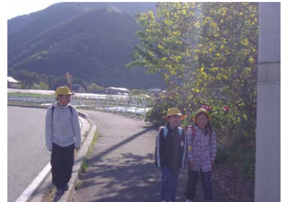
⑥ 歩行者の安全確保 歩道が整備され通学の安全が確保された。