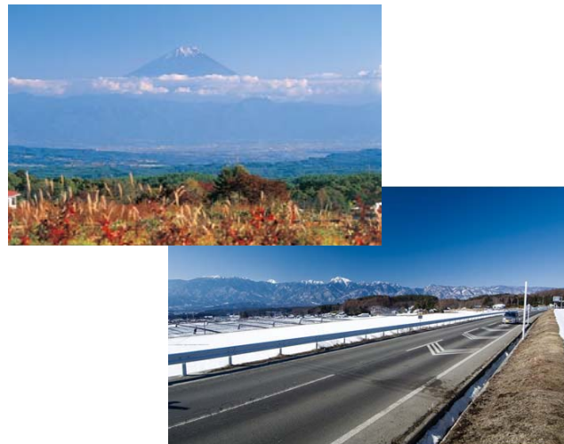
⑤ 良好な景観の創出 北杜市のすばらしい景観「北杜24景」に選定され HPに公開されるなど、観光資源として位置づけ られている。