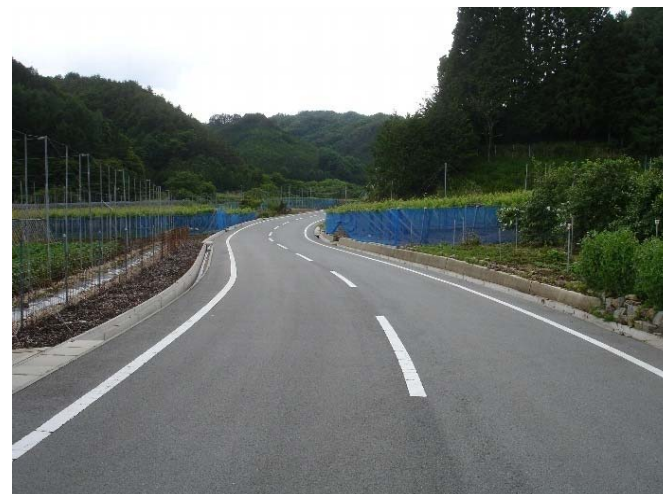
完成後 農道の整備により、農耕車が容易にすれ違えるなど、安全性と農作業の利便性が向上された。