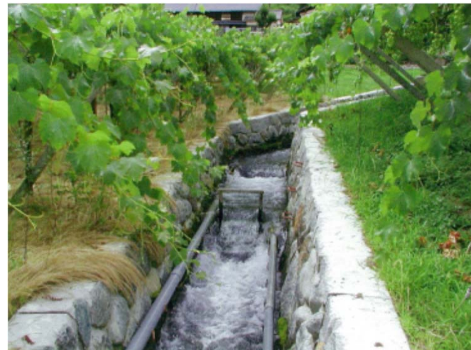
完成後 自然石を利用し、環境に配慮した水路整備により、流下能力が高まり、畑が水食されることが無くなった。