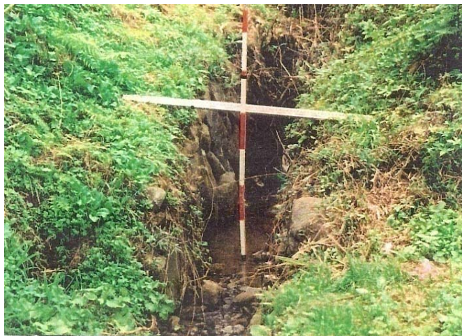
着工前 通水断面が狭く、未改修の土水路であるため、少量の雨量でも溢水し、畑の表土を押し流すことが、度々あった。