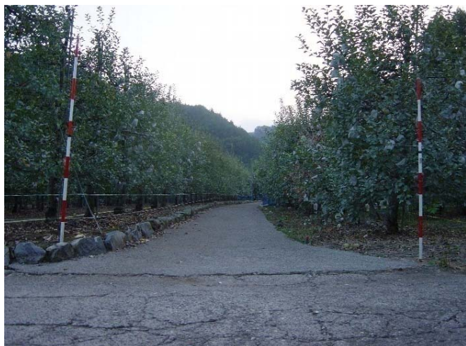
着工前 農道の幅員が狭く、通作などに支障を来していた。