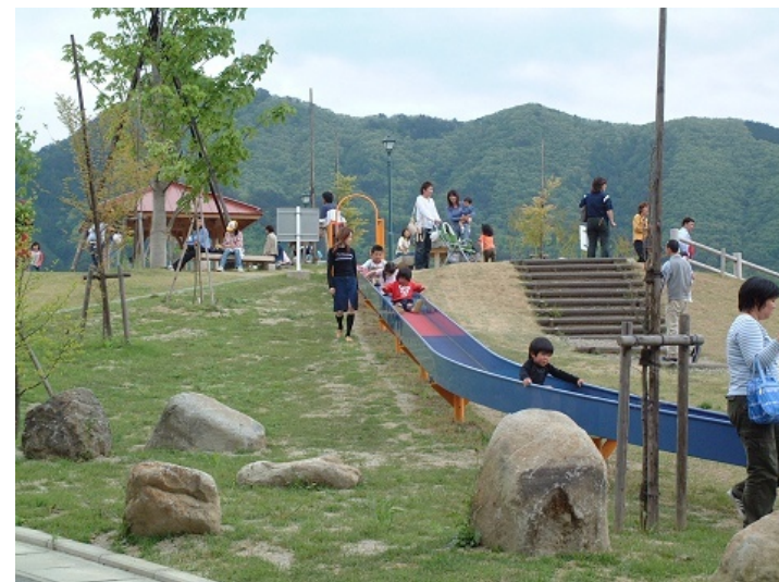
多目的活性化広場