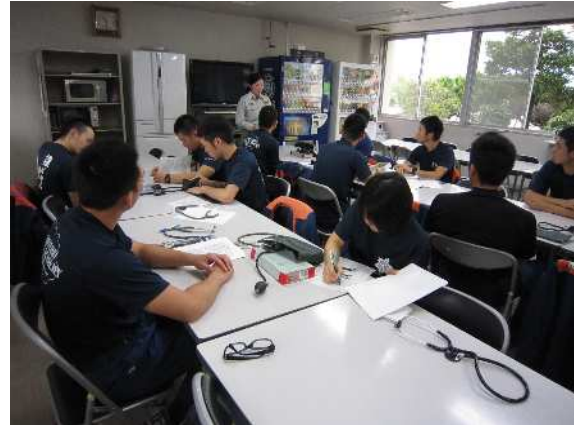
応急処置（血圧測定）