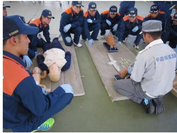
応急処置（気道管理・異物除去）