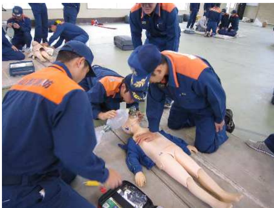
応急処置（心肺蘇生法）