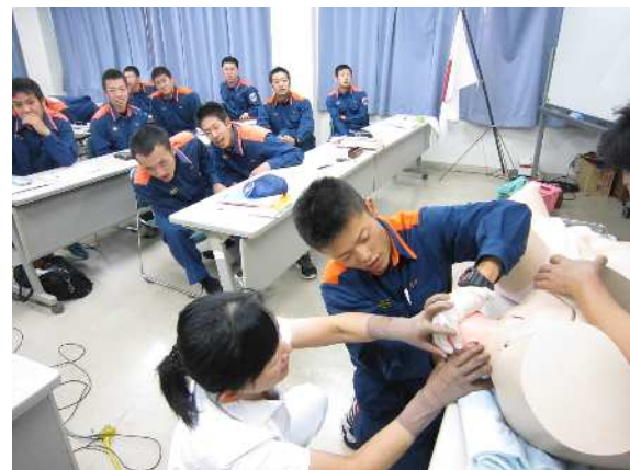
応急処置（分娩介助）