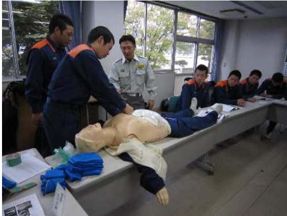
応急処置（外傷処置）