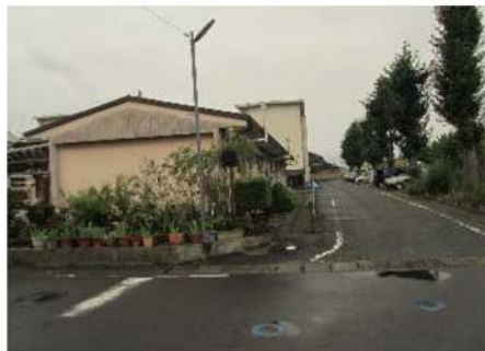
① 解体1号館 (東側外観)