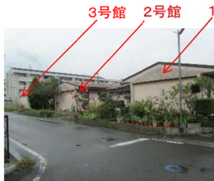
② 解体1・2・3号館 (東側外観)