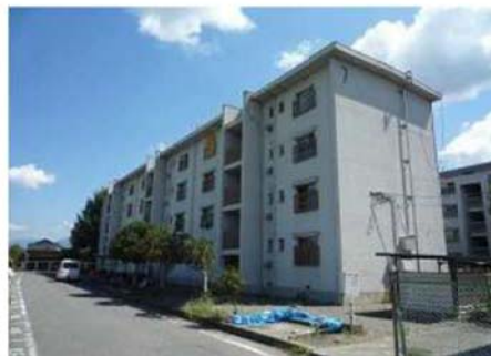
⑥ 解体7号館 (北側外観)