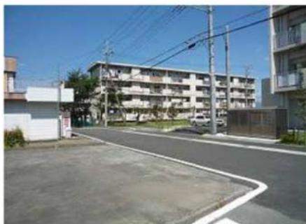
⑤ 解体6号館 (南側外観)