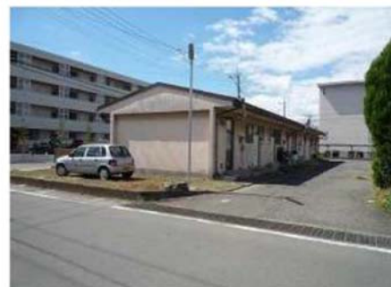
③ 解体3号館 (東側外観)