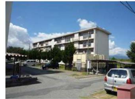
④ 解体5号館 (南側外観)