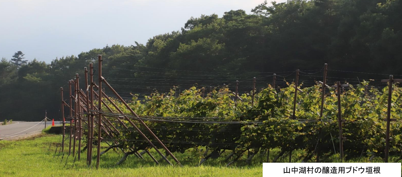
山中湖村の醸造用ブドウ垣根