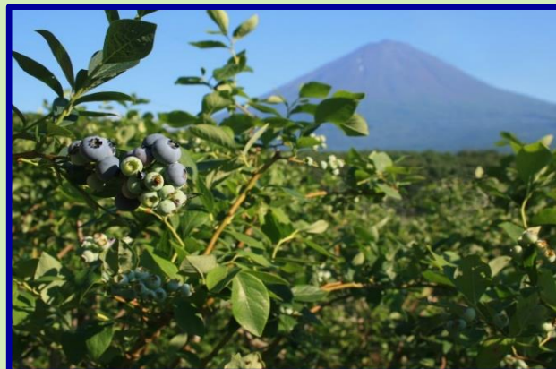
富士を望む ブルーベリー