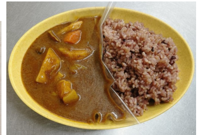
無添加野菜カレー 660kcal 530円