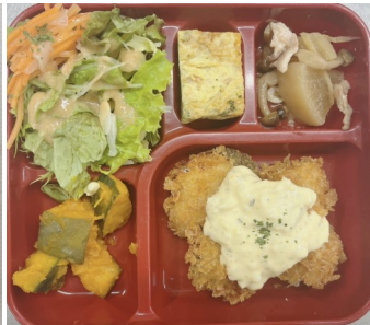
タラのフライ タルタルソース1006kcal