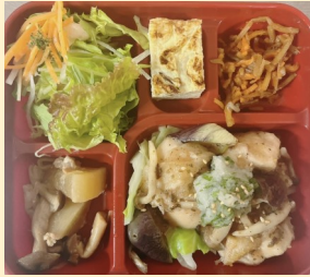
月曜日の日替り弁当

月曜日 鶏肉のネギ塩だれ 779kcal 火曜日 イタリアンハンバーグとアジフライ 771kcal 水曜日 酢鶏 883kcal 木曜日 ナスの肉詰め 801kcal 金曜日 ローストチキンのマスタードマヨネーズ 879kcal