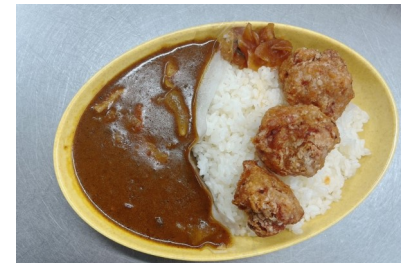
唐揚げ無添加野菜カレー 650円 940kcal