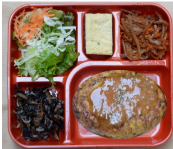
有機豆腐と地鶏のハンバーグ 832kcal