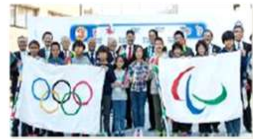
フラッグツアーは、東京都・大会組織委員会等に各県が協力し、昨年度より全国で実施しています。