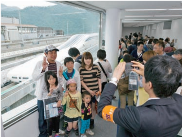
体験乗車したリニア車両をバックに記念撮影する参加者