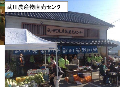
②多くの人で賑わう農産物直売所