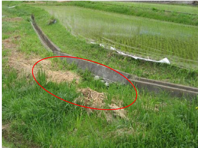
①老朽化により転倒し、水路が閉塞している。