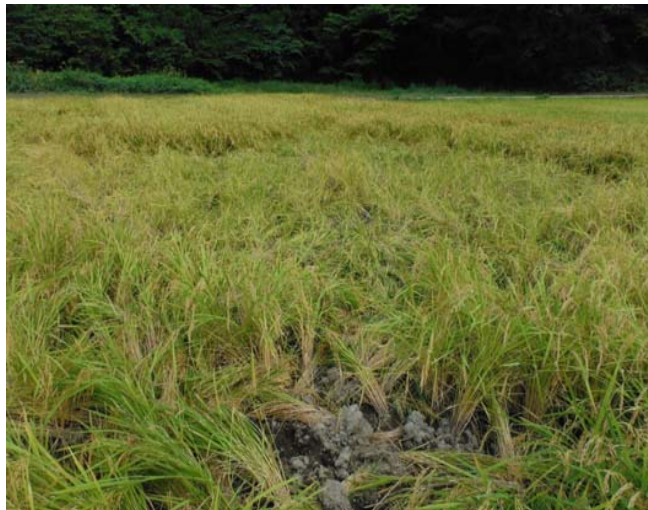
③野生獣(イノシシ)による被害状況