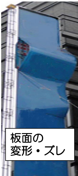
板面の 変形・ズレ