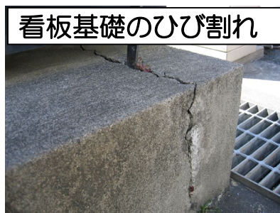
看板基礎のひび割れ