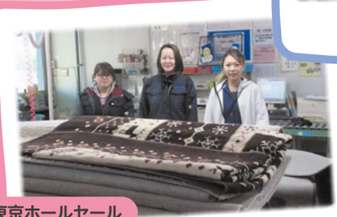
甲信東京ホールセール