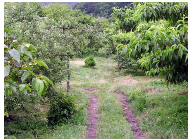
②区画整理エリアは未整備の農道が多く、耕作放棄地化した農地が点在している。