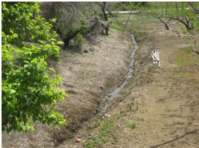
①土水路のため排水不良が発生している。