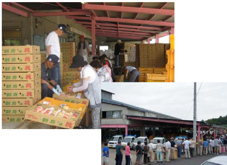
③桃の出荷や直売で賑わう新府共選場