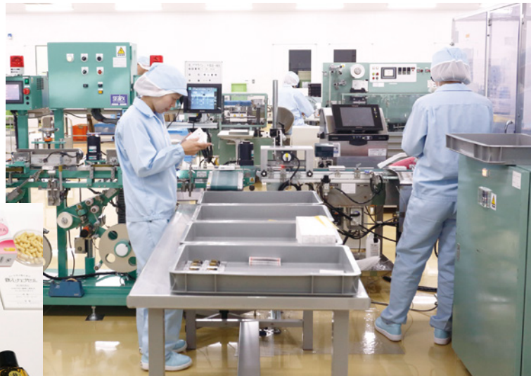
製造された医薬品は、人の手や目により厳しく検品される