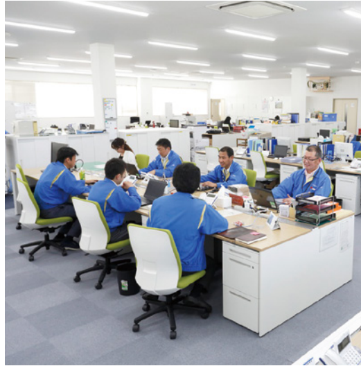
真新しく広々としたオフィス

沖電気工業(株)の100%子会社、(株)沖センサデバイスとして平成8年に分離独立し現在に至る。自動車や家電、産業機器など幅広い分野で利用されているリードスイッチおよび、その応用商品の開発・設計・製造・販売を行っている。グローバルなビジネス展開により、業界トップのシェアを獲得している。