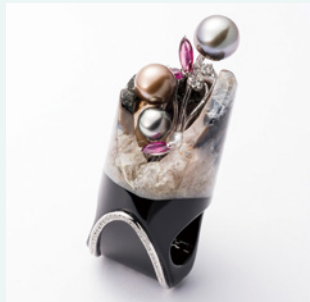
「待宵」デザイン:米山美香 制作:河野道一(河野水晶美術) ジュエリーアートクレアール

本展では、山梨の宝石研磨職人たちが新たな感性によって生み出したジュエリーを紹介します。またジュエリーミュージアム所蔵作品より「甲州水晶貴石細工」の名工によるジュエリーも併せて展示。地場産業の発信地としてさらに進化していく「宝石のまち」の姿をご覧ください。