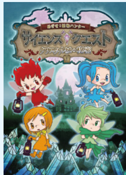
サイエンス・クエスト

水晶をはじめとする「鉱物」にスポットを当て、鉱物の成り立ちや鉱物を生かす技術などを分かりやすく紹介します。さらに、新感覚の映像アトラクションと科学クイズに挑戦しながら学べる体験型展示も行います。山梨や鉱物の魅力をぜひ体感してください。