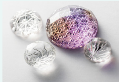
「甲州貴石切子」 清水幸雄 (榊シメズ貴石) 深澤陽一 (ジュエリークラフト フカザワ)