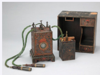
エレキテル (国立科学博物館蔵)