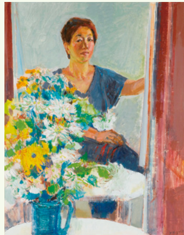
佐野智子《自画像》 1980年代 油彩・麻布(韮崎大村美術館蔵)