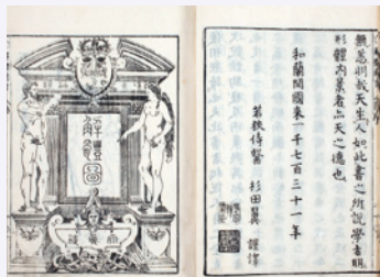
解体新書(国立科学博物館蔵)