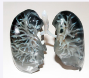
3Dプリンタ臓器模型