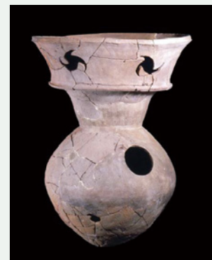
壺形埴輪 山梨県指定文化財 甲斐銚子塚古墳出土 (山梨県立考古博物館蔵)

県内古墳から出土した埴輪にスポットを当て、古代の魅力を紹介します。夏休み期間中の開催に合わせて子どもたちの素朴な「なぜ?」にも答えながら、埴輪からみた山梨の古墳時代について考えます。