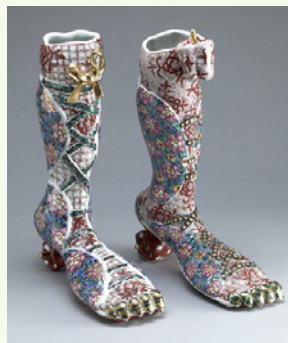
松田百合子《In her shoes》 2009年 陶(個人蔵)