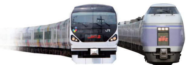
特急「かいじ」・「あずさ」 特急「スーパーあずさ」