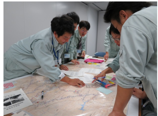
グループ活動（事務所）