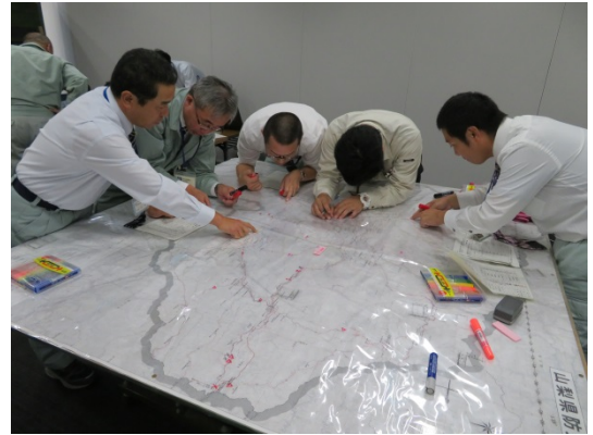
グループ活動（本部）