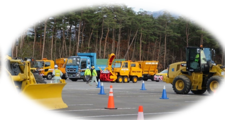
効率的な除雪訓練状況