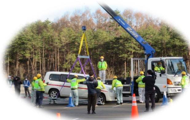
放置車両移動状況