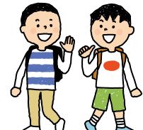
⑤放課後、友達と遊ぶ約束をする。