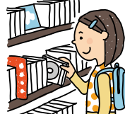
③レンタルショップでCDを借りる。