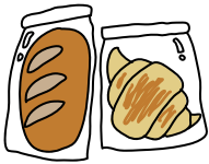
①パン屋でパンを買う。