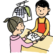
クリーニングで洋服を出す