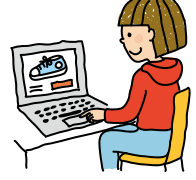
インターネットで買い物をする

消費者とは、お金を払って商品やサービスを買って生活をしている人のことです。子どもから大人まで私たちはみんなが消費者であり、消費者として社会に参加しています。