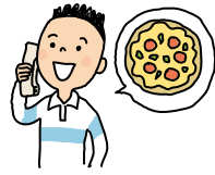
②電話でピザを注文する。