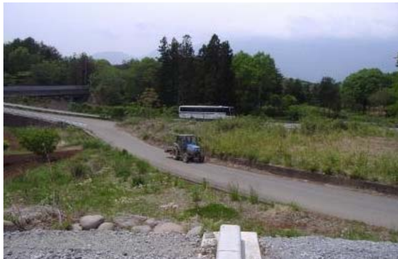
②中央自動車道跨道橋