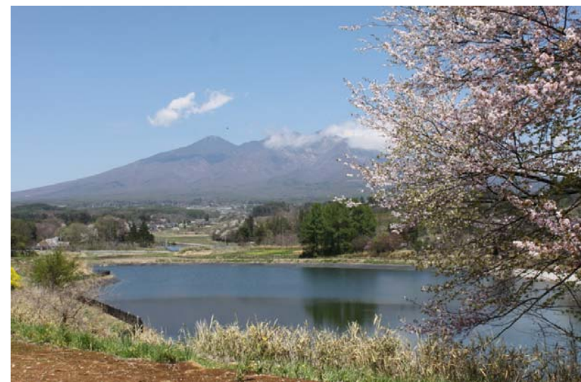
沿線の景観散策スポット（越中久保ため池からのハヶ岳）