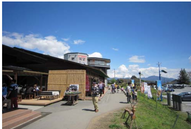
観光客で賑わう三分一湧水館・農産物直売所