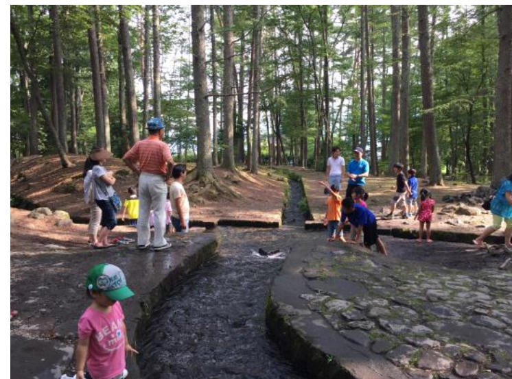
日本名水百選にも選ばれている三分一湧水