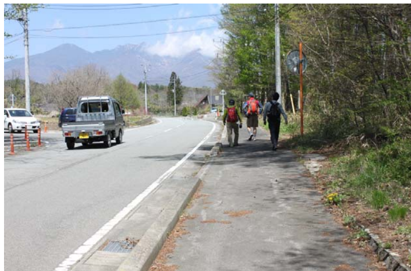
沿線の観光地を散策する観光客