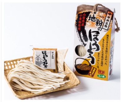
山梨県産小麦を100%使用