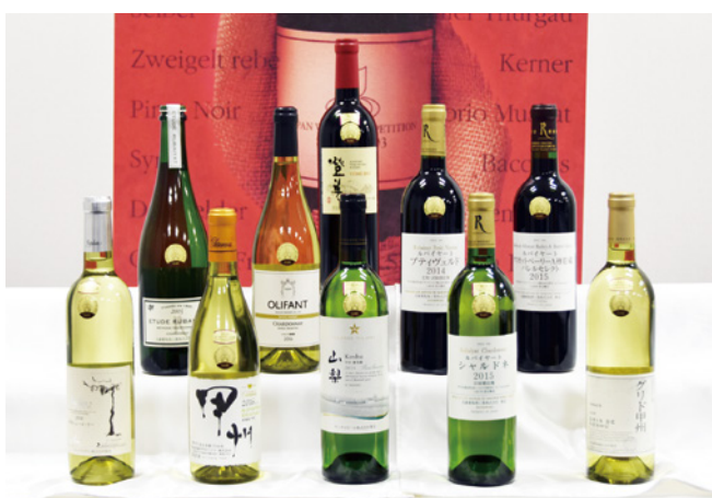
金賞を獲得した県産ワイン10点。うち3点は部門最高賞を受賞

日本ワインの品質は、近年大きく向上し、国内外における人気も高まりを見せています。今後このコンクールを通してさらなる飛躍が期待されます。