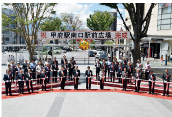
全ての方にとって安全で使いやすくなった、甲府駅南口駅前広場

今回の駅前広場の完成により、人の流れが中心市街地へと向き、観光振興や地域経済の活性化につながることを期待できます。