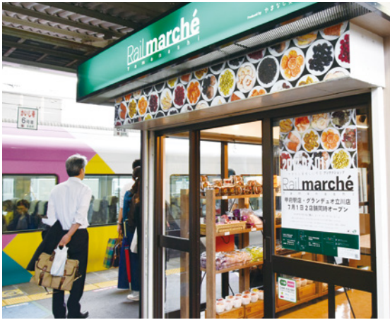
JR甲府駅にオープンした「やまなしRail marché(レイルマルシェ)」

山梨県は、県産農産物を使った加工品開発を行う「美味しい甲斐開発プロジェクト」を推進しています。今回、このプロジェクトのメンバーを中心に設立された「一般社団法人やまなし美味しい甲斐」が、JR東日本との連携により、JR甲府駅上り線ホームとJR立川駅ビルのグランデュオ立川1階に、アンテナショップ「やまなしレイルマルシェ」をオープンしました。同法人では、マルシェでの県産農産物を使った加工品や果物などの販売を通して、消費者の声を聞きながら、さらなる商品開発に取り組んでいきます。