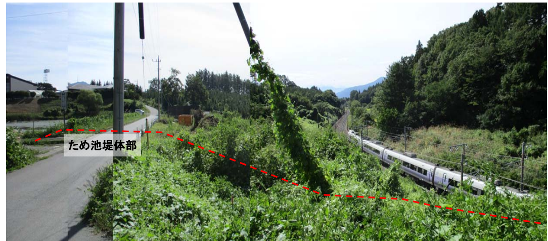
④ 堤体直下にはJR中央線があり、大規模地震の際には甚大な被害のおそれがある。