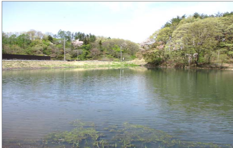
① 米山ため池の全景