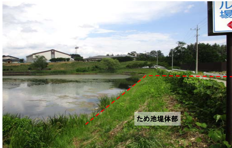
③ 堤体の安全性が低く崩壊が危ぶまれている