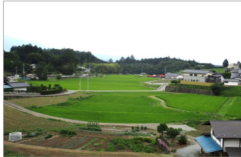
② ため池下流の受益農地の状況