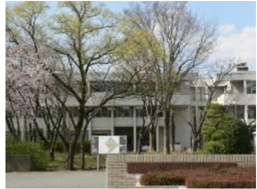
総合教育センター