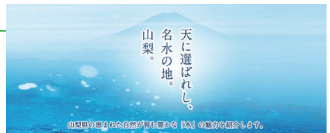
本県の水の魅力をホームページなどで強力に情報発信

富士の国やまなし観光ネットリニューアル事業費 4,023万円 周遊・滞在型観光の推進を図るため、情報発信機能を強化。