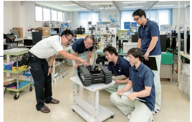
地域経済の持続的な発展を図るため、県内企業の成長産業への参入や事業拡大を支援

大村智人材育成基金事業費 2,053万円 基金を活用し、高校生・大学生の留学や若手研究者の研究を支援。