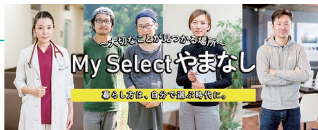
若年層に向け、本県で暮らす魅力をホームページなどで強力に情報発信