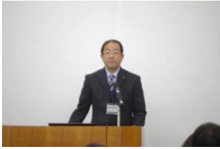
県教育委員会あいさつ

その後、地区別にグループに分かれて保幼小連携の状況や課題点について意見交換を行い、再度全体会においてグループの討議内容を発表しました。最後に助言者から講評と連携・接続の課題についてアドバイスを受けました。