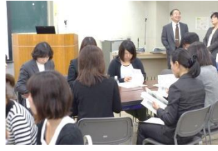
地区別のグループ討議