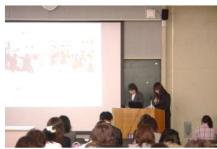
奥野田小・保育園の発表