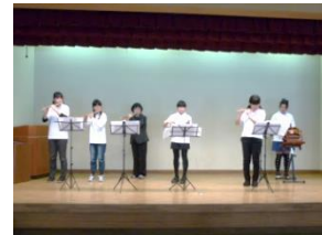
篠笛を演奏する子どもたち