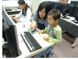
パソコンで入力をする様子