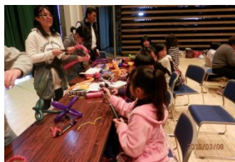
アートバルーン作りの様子