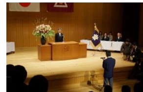
誓いの言葉、決意を新たに