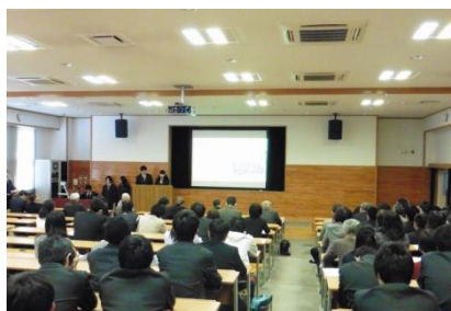
生徒代表の活動報告

日川高校では、3月11日に「スーパー・サイエンス・ハイスクール（SSH）研究発表会」を開催しました。SSH指定3年目を迎えた日川高校では、県内外の大学・研究機関等と連携しながら、社会性や国際性を備えた次代を担う科学者・技術者の育成をめざして、効果的な教育プログラムの研究に取り組んできました。この日の研究発表会では、まず生徒代表により一年間の活動報告と課題研究発表が行われ、その後、各研究グループごとに、模造紙にまとめた研究成果を来訪者に説明する「ポスターセッション」が行われました。化学・地学・物理・生物・数学各分野のレベルの高い研究内容と、生徒の熱のこもった説明に、来訪者は熱心に耳を傾けていました。