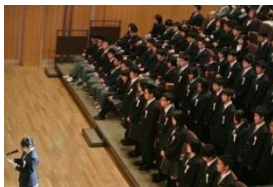
桃花台学園73名でスタートです

平成27年4月9日、笛吹市石和町中川に軽度の知的障害生徒を対象とした高等部のみの特別支援学校、「高等支援学校桃花台学園」が開校しました。同校は「自分に誇りと自信を持ち、他者への思いやりや協調性を培うとともに、職業教育を通して、意欲的に社会参加する力を養成する。」という教育目標を掲げており、「産業技術科」の中に「農業生産コース」「食品加工コース」「環境メンテナンスコース」の3コースが設置されています。校名は、笛吹市の市の木であり本県を代表する果樹である「桃」と、春に扇状地一帯を彩る「桃の花」、さらには職業教育の基盤として確固たる存在にという願いを込めて「台」の字を用いてつけられました。34名の新入生と、かえて支援学校分室から転入学した2・3年生を合わせた73名が、職業自立に必要な能力と実践的な態度の習得を目指して、産業技術科の特色ある学習内容に意欲的に取り組んでいます