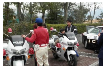
白バイに乗ったよ!