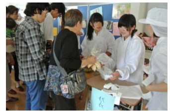
【桃花ダイスキマーケット】