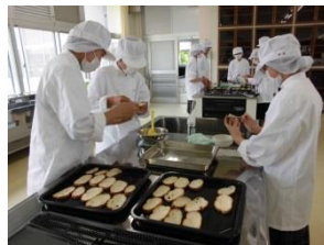
【食品加工・ラスク作り】