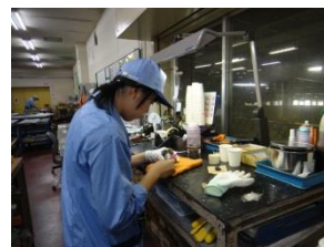
【企業での現場実習】