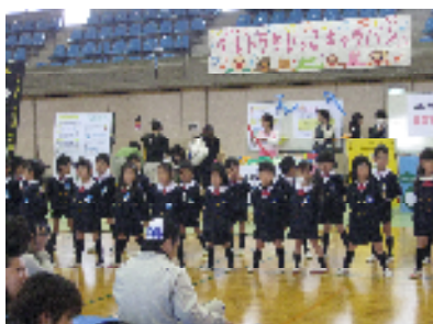
くさかべ幼稚園児の発表

4月28日(水)、「ウルトラちびっこキャラバン in 山梨市」が山梨市民体育館で催されました。これまでに何回か NPO 法人子育て支援センターちびっこはうすの主催で開催されていましたが、今回は行政も共催することとなり協働での開催でした。当日は雨にもかかわらず、会場には赤ちゃんをだっこしたお母さんや幼児と手をつないだお母さんの姿があり、180組を超える親子が参加していました。