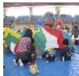
みんなでパラシュート

地域の未来を担う子どもたちのために、地域でも子育てを応援して下さる方々が増え、子育て中の親をサポートして下さる機会が増えることを願っています。