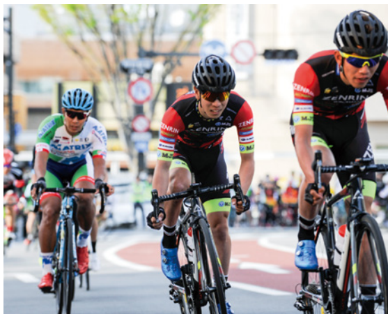
平和通りを疾走し、サイクルロードレースの魅力をPRする参加選手ら

今回初めて実施されたこのレースは、甲府駅南口から県防災新館前までの平和通りを周回するもので、約60人が参加したパレードの後、プロ選手らによるレースが行われました。スピード感溢れるレースを目の当たりにした観衆は、熱心に声援を送ったり、選手の勇姿をカメラで撮影したりするなどし、大きな盛り上がりを見せていました。