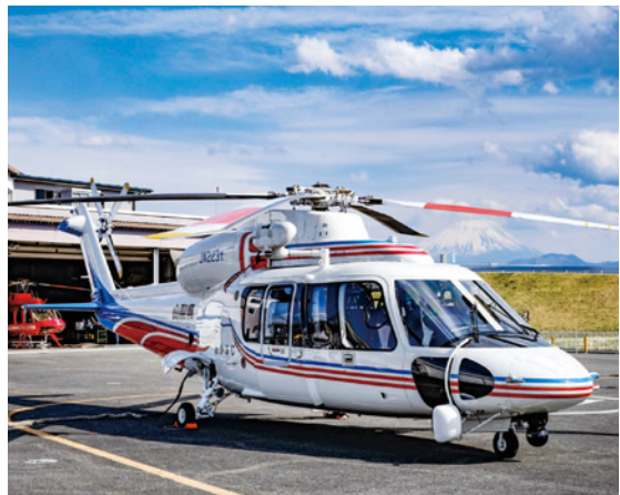
新「あかふじ」の機体外観

では、導入から20年以上が経過し老朽化が進んだことから、消防防災ヘリコプター「あかふじ」を更新しました。山々に囲まれた地形において、ヘリコプターによる活動は効果的ですが、危険を伴います。このため、操縦士や消防防災航空隊員らが新しい機体に慣れるための訓練を重ね、新「あかふじ」は7月下旬から正式に運航を開始する予定です。