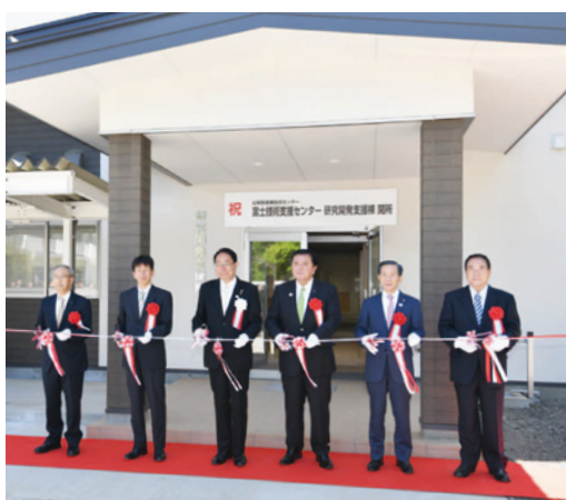
新たに整備された研究開発支援棟の開所式

今後、この支援棟が新製品の開発などに活用されることで、企業の成長や地域の活性化につながることが期待されます。