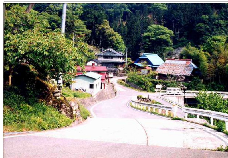
②三石山線沿線の集落(大崩地区)の状況