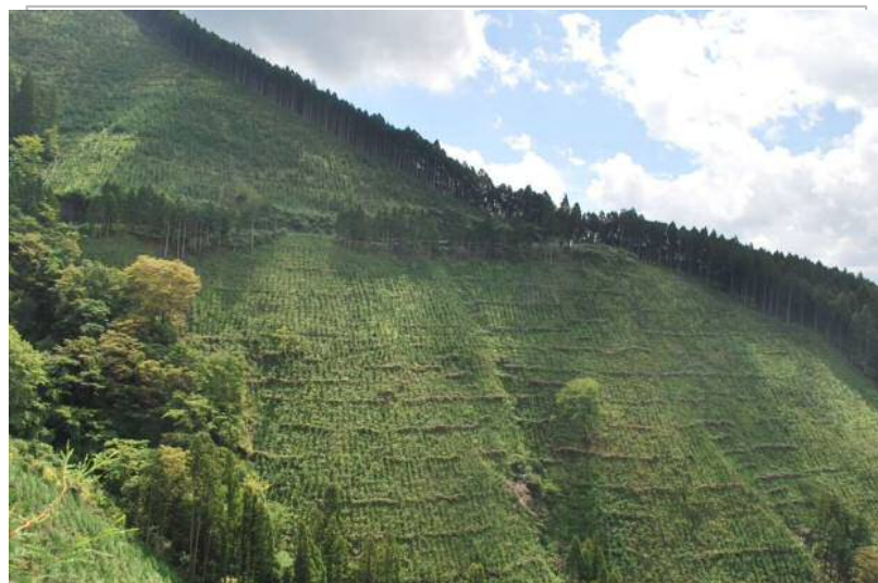
③造林地における新植箇所状況