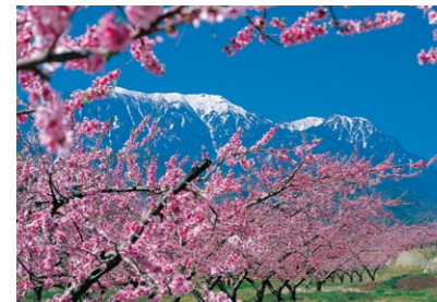
3 新府桃源郷と南アルプス