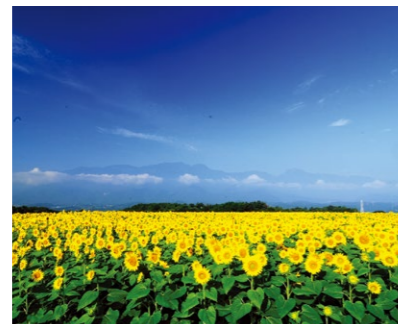
2 明野のヒマワリ畑