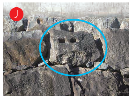
鍛冶曲輪の石垣：未使用の矢穴