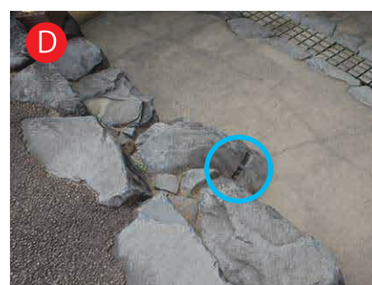
鉄門下の岩盤（左）・銅門下の岩盤：目立たない矢穴 実は、石段（石の階段）のふりをした岩盤がかくれているよ。 そこには、矢穴が彫られているんだ。