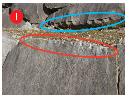
帯曲輪の石垣： 江戸時代の矢穴と現代の矢穴