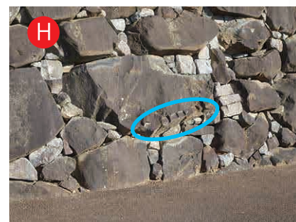
天守曲輪の石垣：近くで見られる矢穴