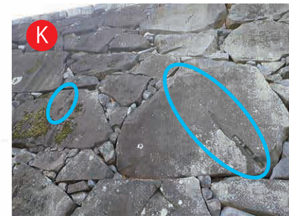
稲荷曲輪の石垣：彫りかけの矢穴 彫りかけの矢穴が並んで積まれて いるよ。よく見ると、矢穴を彫る下 書き線が書かれているよ。