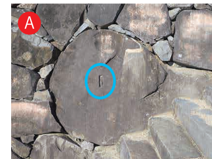
天守台石垣：彫りかけの矢穴 天守台の石段脇にある彫りかけの 矢穴。一個だけ彫りかけでやめている ところにドラマを感じるね。彫り 方がよく分かる矢穴なので、石工（ 石を加工する職人）を目指すみんな は、お手本にしよう。