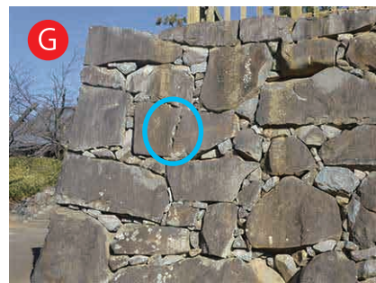
天守曲輪の石垣：未使用の矢穴

矢穴が彫られたのに、石は割れて いないよ。矢穴を彫る場所をまちが えちゃったのかな？