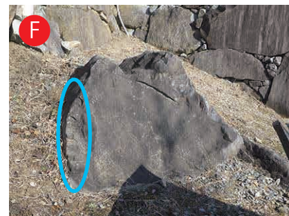
中の門脇の岩盤の矢穴