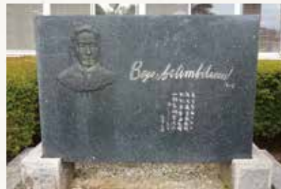
石橋湛山の母校の後身、甲府第一高等学校にある石橋揮毫の「Boys, be ambitious」の碑(左の胸像は恩師にあたる大島正健校長の姿)