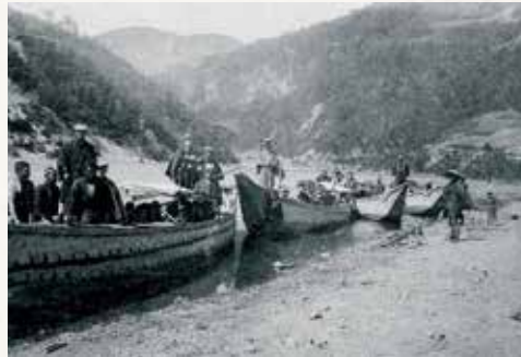
富士川舟運の歟沢(富士川町)の乗船場(山梨県立博物館蔵)

この富士川のみちを辿り、多くの山梨の人々が旅立ち、また新たな文化が山梨にもたらされたのです。