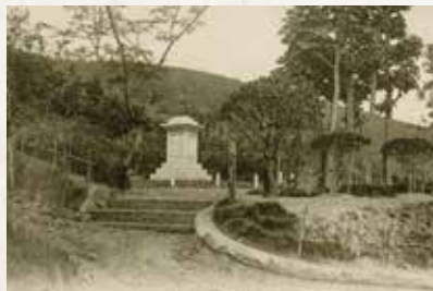
甲府の愛宕山にあった若尾逸平像(個人蔵)