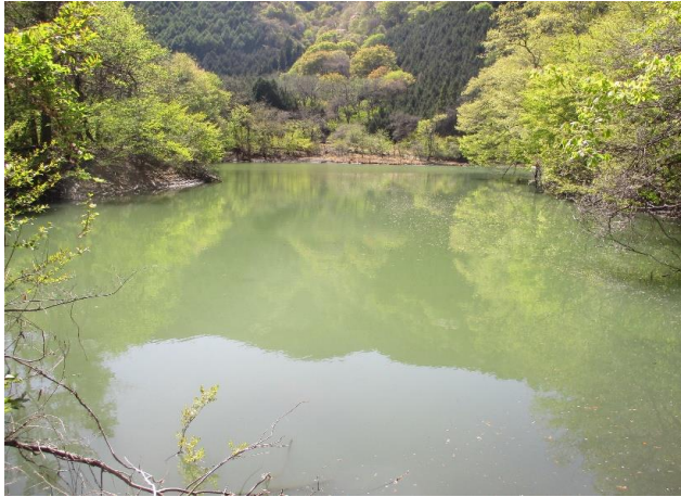
① 池の平ため池 全景 貯水量 34,500m 3 , 堤高 H=6.8m