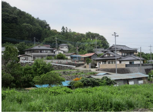
② ため池下流には人家があり、大規模地震の際には甚大な被害のおそれがあるため、早急に対策を講じる必要がある。