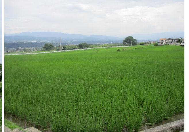
③ ため池下流の受益農地の状況