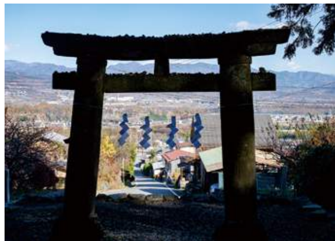
武田八幡宮二ノ鳥居からの遠望

また、山梨は古代から馬の産地であり、朝廷に馬を貢納するための牧場・御牧(みまき)が置かれていました。馬の飼育に精通した渡来人の文化がいち早く取り入れられたこと、八ヶ岳山麓のなだらかな斜面、御勅使川(みだいがわ)の広大な氾濫原などが牧に適した土地だったことによると考えられます。牧には、馬、そして馬を飼育し訓練する技術者がおり、牧を作るために伐った木は木材として、あるいは鉄生産のための燃料としても活用されました。こうしたことが、甲斐源氏の発展に影響を与えたと考えられます。