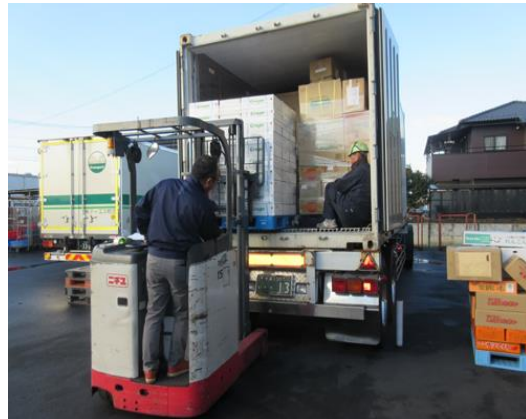
写真2 ブドウ積載時の様子

度保持資材、すなわち本調査における試験区は9月および10月収穫果房について、①酸素濃度の調節機能 (Modified Atmosphere, 以下MA) および結露防止効果のあるMA袋 (P-プラス結露防止袋 (酸素透過率3%), 住友ベークライト株式会社) で果房を包装 (以下, MA区), ②穂軸に水分補給容器 (4.0n、有限会社フレッシュ) を装着 (以下, 水分補給容器区), ③果実袋 (D-20, 小林製袋株式会社) で果房を包装 (以下, 果実袋区) の3区を設定した。