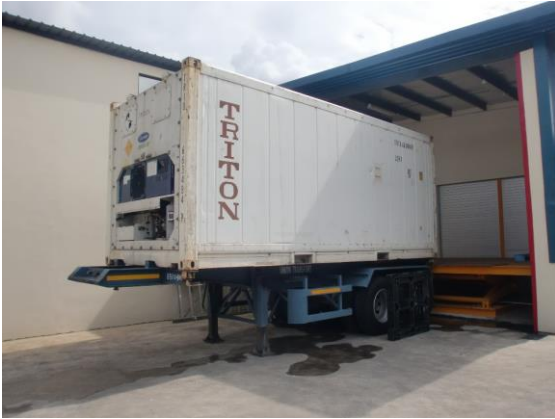
写真1 リーフコンテナ外観