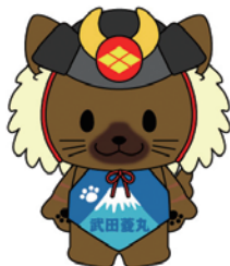
山梨県 キャラクター 武田丸 (ひしまる)

全国有数の日照時間を誇る本県では、優良な再生可能エネルギーである太陽光の活用を推進しています。